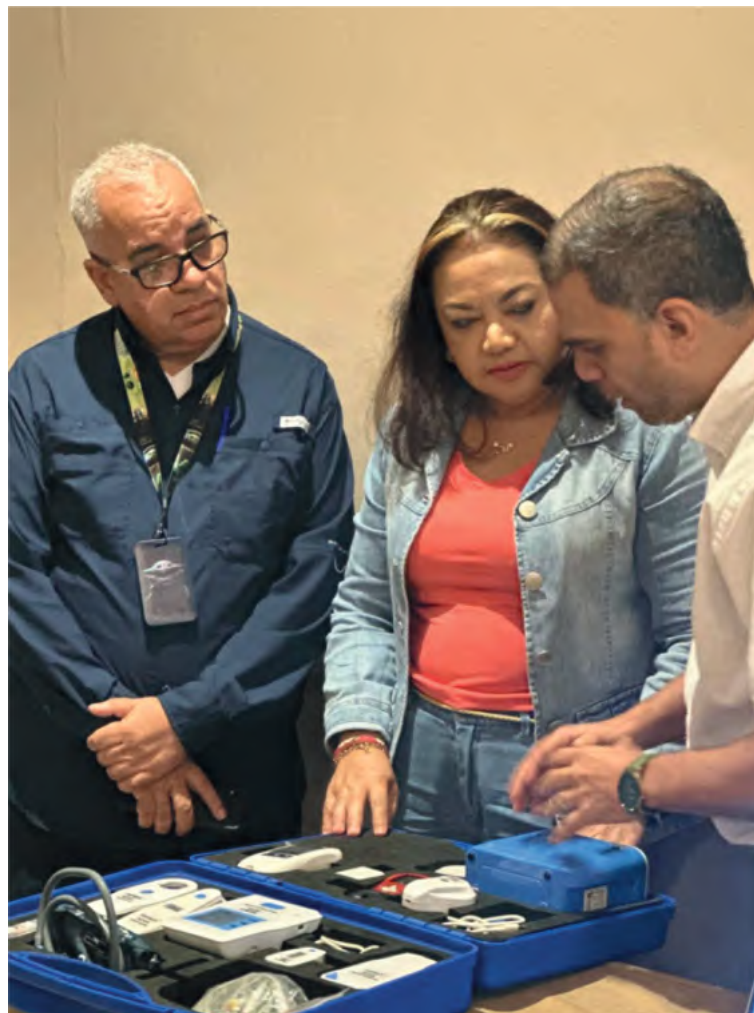
Uso de maletines con dispositivos médicos portátiles para telemedicina.