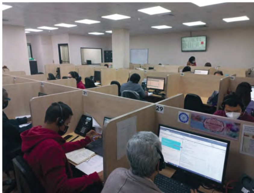
Centro de Contacto de Llamadas del Ministerio de Salud donde se brinda la atención a través de telemedicina.