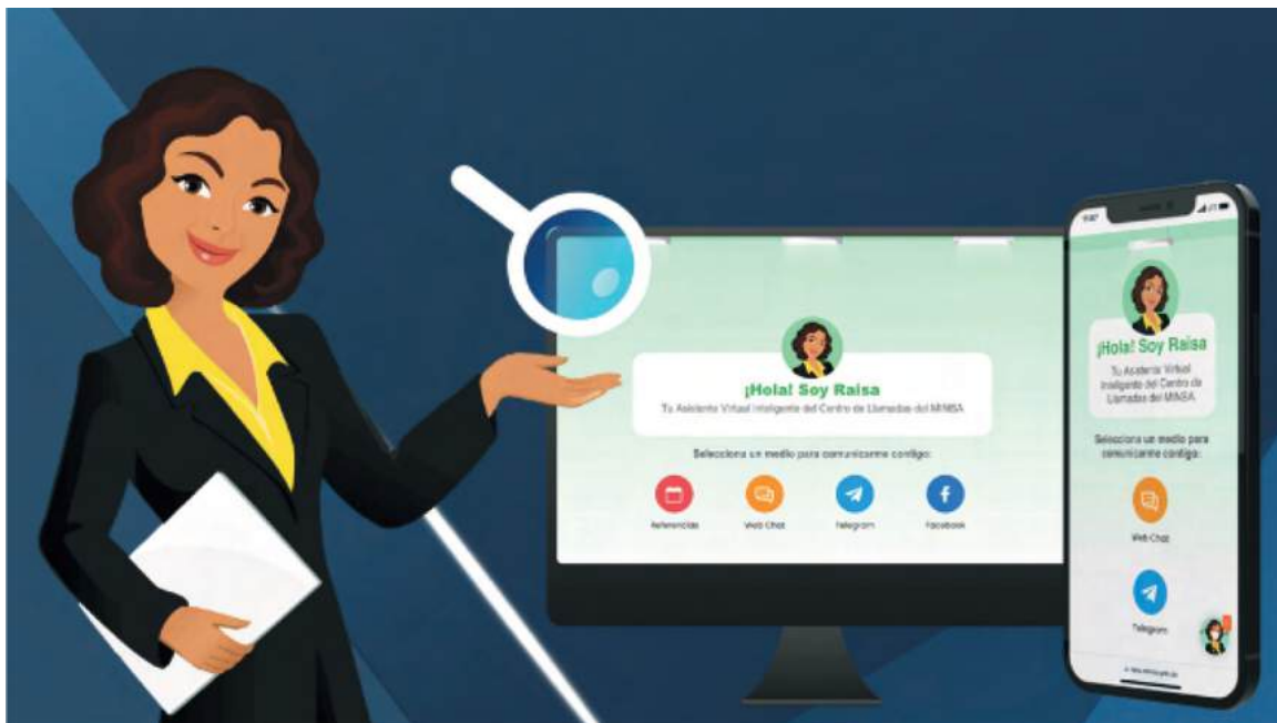
Plataforma Pre-Cita (RAISA).