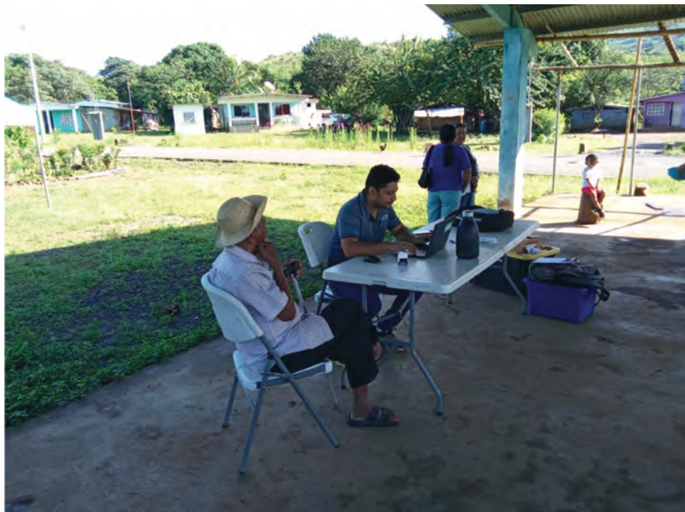
Atención médica en áreas de difícil acceso de la provincia de Veraguas, a través del expediente clínico digital offline Medigiras.

Con la finalidad de facilitar la comunicación de los resultados, la Comisión para la Transformación Digital en Salud debe elaborar y presentar informes periódicos que sirvan como medio de divulgación de los avances, desafíos y resultados obtenidos con todas las partes interesadas.