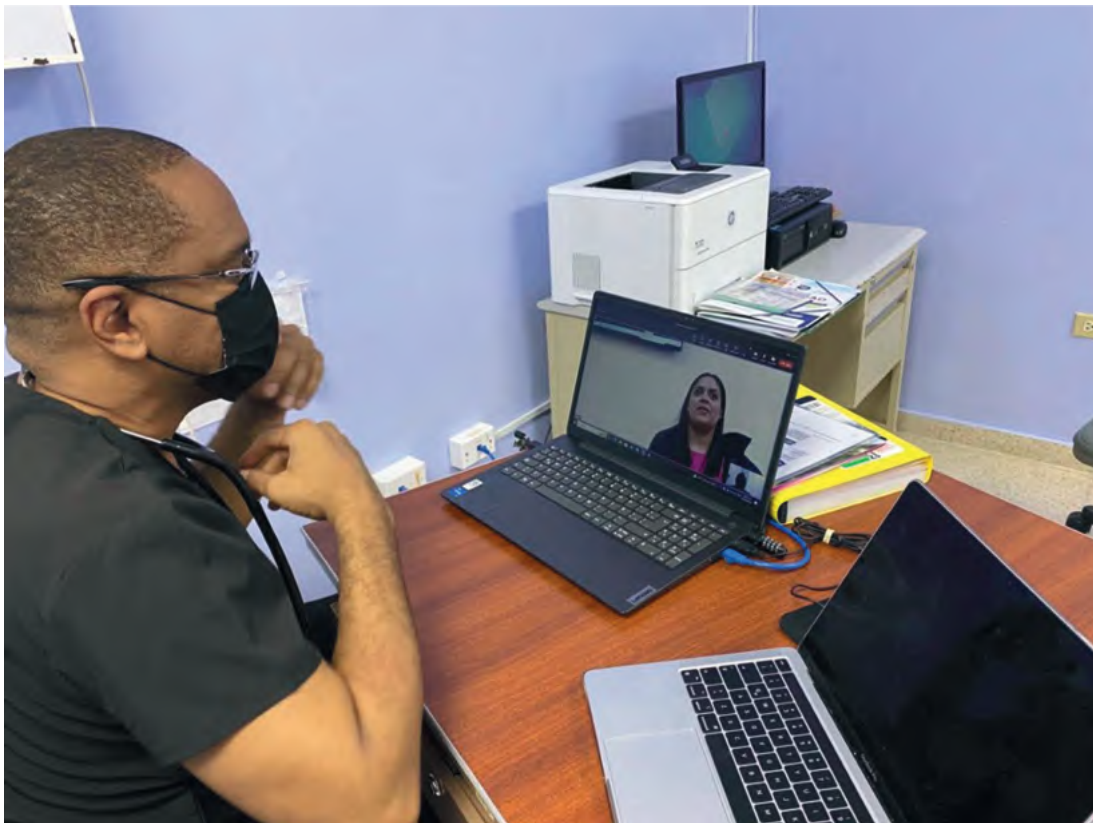
Uso de telemedicina en el Hospital San Miguel Arcángel.