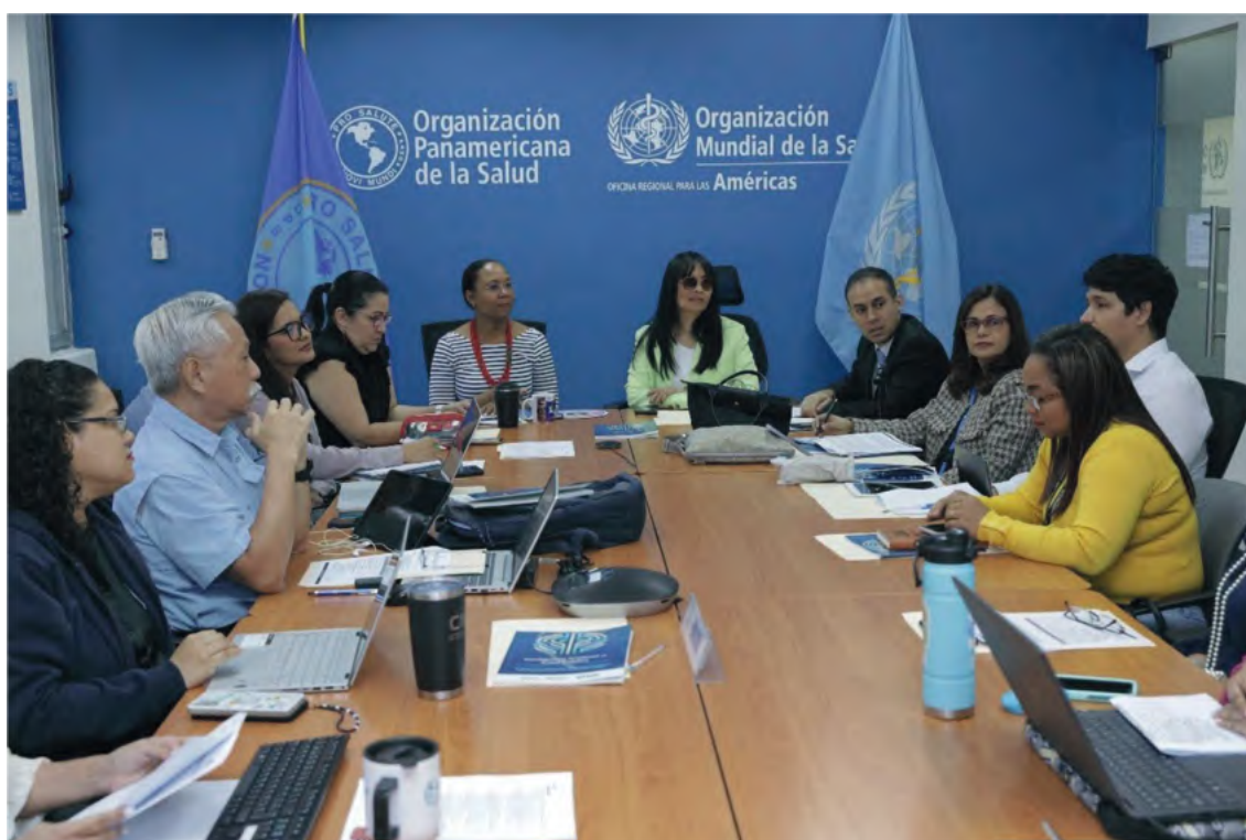
Reuniones para la validación de las líneas de acción de la Estrategia Nacional para la Transformación Digital en Salud

Posterior al taller, la OPS/OMS Panamá, realizó la fase de condensar y esquematizar todas las opiniones y sugerencias aportadas en el MIRO BOARD y la Dirección de Planificación de Salud del MINSA, generó un borrador de la Estrategia de Transformación Digital en Salud para revisión por parte de los comisionados.