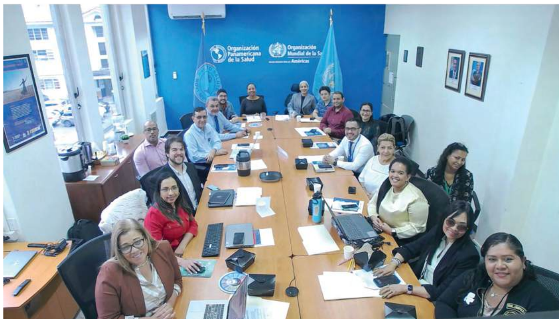
Reuniones de la Comisión Nacional para la Transformación Digital en Salud

El Decreto Ejecutivo N°36 del 24 de julio de 2023 modifica el Decreto Ejecutivo N°599 del 28 de diciembre de 2016, que crea la Comisión Nacional de Estrategia de Salud, que en adelante se denominará Comisión para la Transformación Digital en Salud e incrementa el número de integrantes con el objetivo de aprovechar las tecnologías de la información y las comunicaciones para mejorar el acceso y la calidad de los servicios de salud.