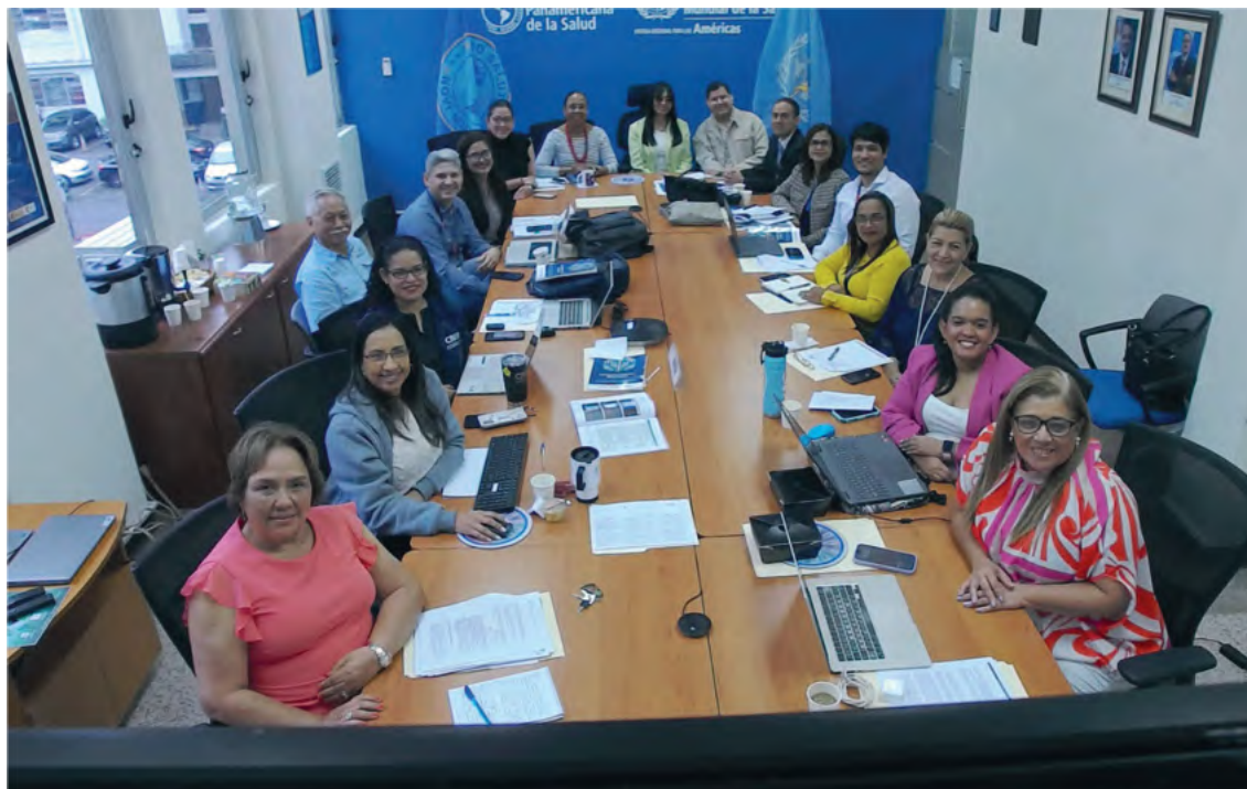
Reuniones de la Comisión Nacional para la Transformación Digital en Salud

Adicionalmente, la Comisión tiene como objetivo mejorar la infraestructura organizativa y tecnológica, fomentar la interoperabilidad de los sistemas de salud y respaldar la gestión del conocimiento, la alfabetización digital y la formación en tecnologías de la información y la comunicación. Estos elementos son clave para garantizar la calidad asistencial, la promoción de la salud, la prevención de enfermedades y el acceso equitativo a la información.