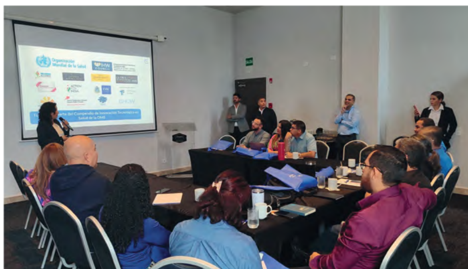
Capacitación en el uso de los maletines de telemedicina a funcionarios de la Región de Salud de Chiriquí y de la Comarca Ngábe Buglé.