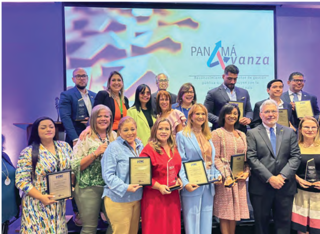
Premiación del Centro Nacional de Competitividad Panamá en la categoría Innovación en la Gestión Pública, otorgada al proyecto SIMEPLANS de la Dirección de Planificación del Ministerio de Salud.