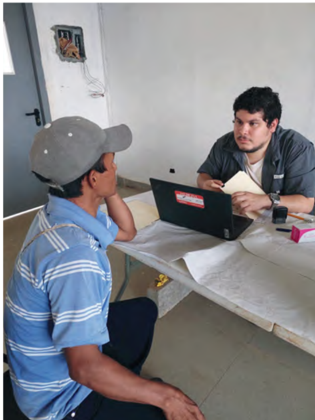
Atención médica en áreas de difícil acceso de la provincia de Veraguas a través de expediente clínico digital offline Medigiras.