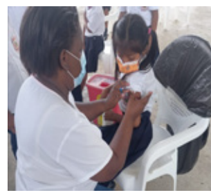
Bocas del Toro