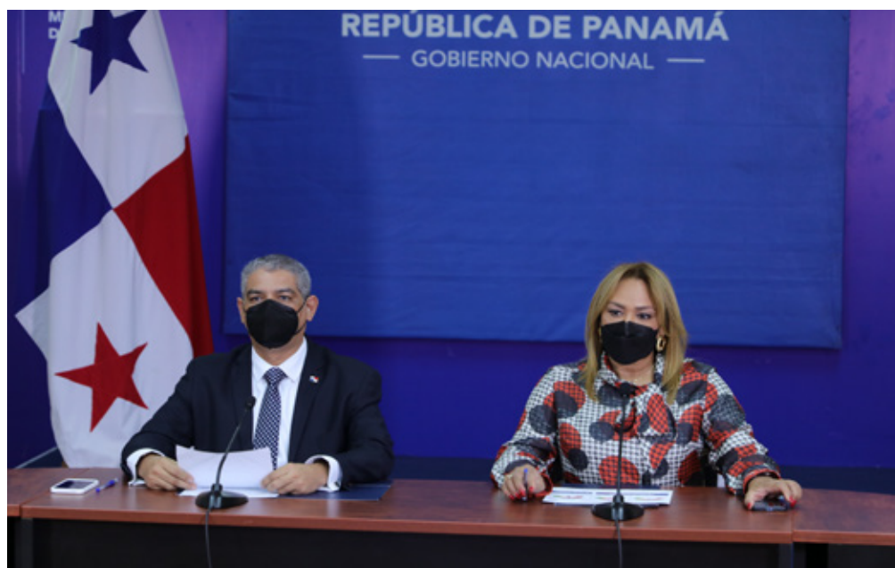
El Ministro de Salud, Dr. Luis Francisco Sucre y la Ministra Consejera para asuntos públicos de la Salud, Dra. Eyra Ruíz explicaron al país la aplicación de la cuarta dosis o segunda dosis de refuerzo contra el coronavirus y sus variantes.

El ministro de Salud Luis Francisco Sucre junto con la ministra consejera para asuntos públicos de Salud, Eyra Ruíz anunciaron la aplicación, de una segunda dosis de refuerzo de la vacuna contra la Covid-19 (Cuarta Dosis), a partir del cuarto mes de haberse aplicado el primer refuerzo (tercera dosis) para personas inmunosuprimidas mayores de 12 años.