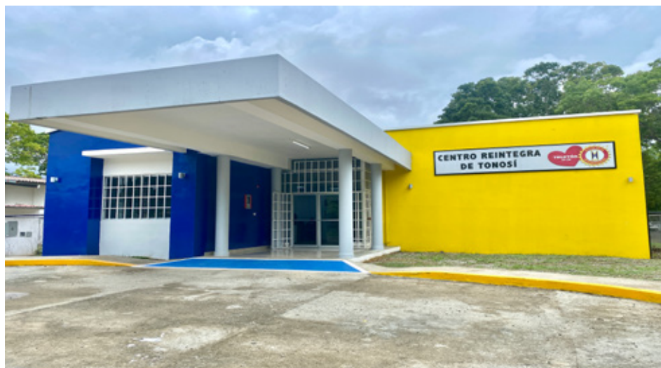
El distrito de Tonosí, en la provincia de Los Santos, registra una alta prevalencia de personas con discapacidad, por lo que Reintgra ayudara en la atención de esta población.