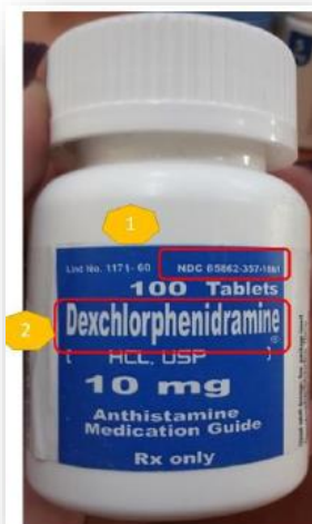
Fotografía del Producto